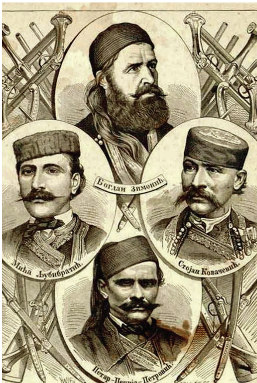
Вође Устѣанка 1875–1878, Орао, 1876.