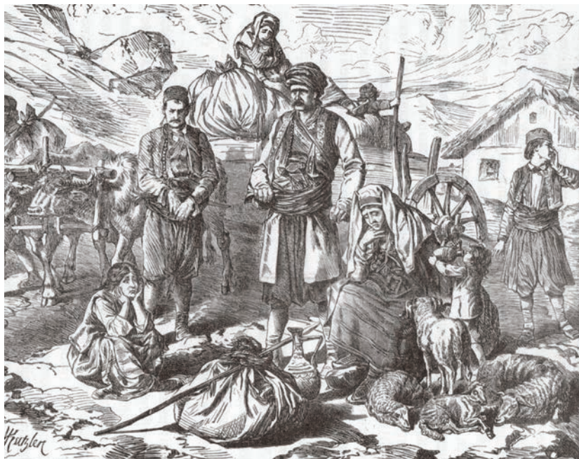
Херцеговачка раја на далмаћинској граници, (Србадија - Беч, година прва, свеска 11, 1875)

послије Карловачког (1699) 506 , Пожаревачког (1718) и Београдског мира (1739). Становништво је своје миграционе циклусе наставило и након ратова током XVIII вијека. Тако је након Аустро-турског рата (1788–1791) у сусједне аустријске области прешло више од 20.000 становника са простора Босне, али и након ранијих ратова у XVIII вијеку још око 100.000 људи. 507