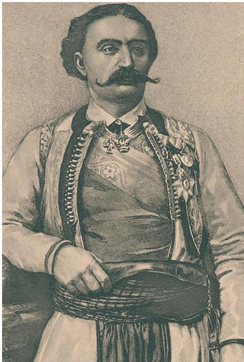
Петар Вукошић - нејознаи аутор, 1878.