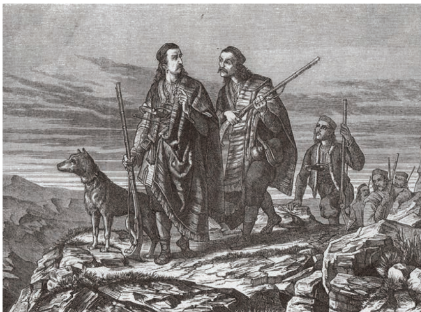
Херцеговачки устаници, (Србадија - Беч, година прва, свеска 11, 1875.)