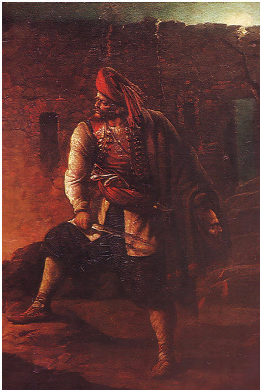
Ђура Јакшић, Црногорац , 1875. Народни музеј Црне Горе, Цетиње