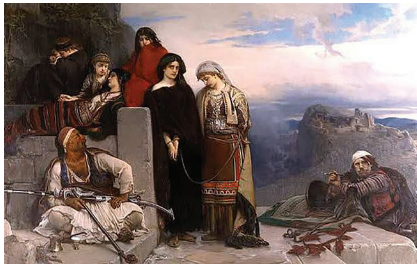
Урош Предић, Херцеговачки бјејунци, 1889, Народни музеј Београд

часописе и новине о патњама народа у предјелима захваћеним устанком, као и да искористи простор да се путем стране штампе обрати за помоћ устаницима. Из његовог рада и рада самог Комитета, проистекло је успостављање организације Црвеног Крста на Цетињу у јануару 1876. Његов помоћник и главни сарадник у Комитету, архимандрит манастира Острог Висарион Љубиша, постао је предсједник ове организације. 463 Чланови овога Комитета били су истакнути војни заповиједници и политичари Књажевине Црне Горе, попут Маша Врбице, Љубе Ненадовића, Стева Капе, Сима Поповића, Шпира Ковачевића и Божа Новаковића. 464