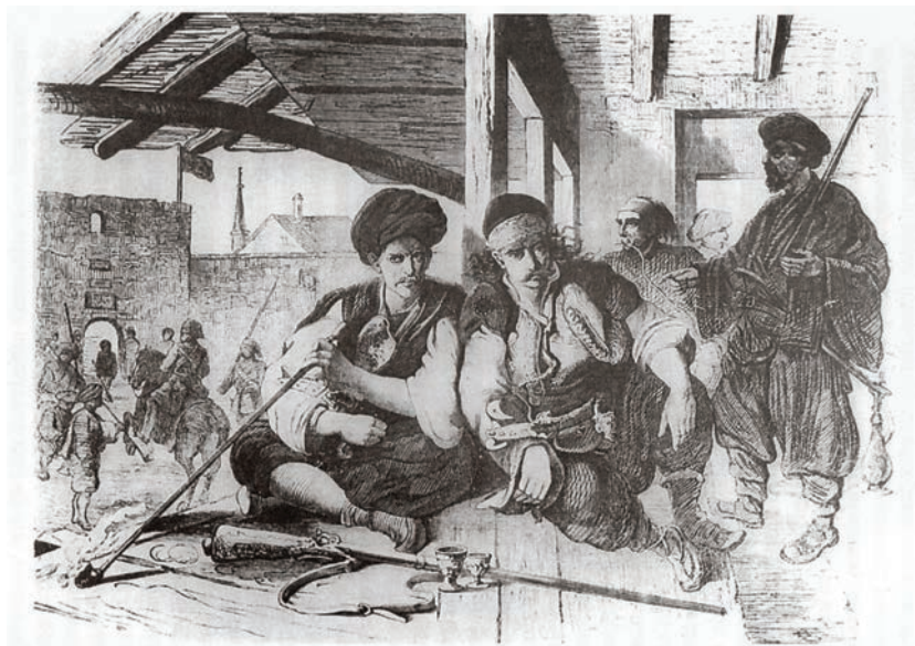
Башибозук у кафани испред кайије у Требињу, (Феликс Каниц)

земљама Западне Европе. То је османски феудални систем чинило доста различитим у односу на исте системе у европским државама. 67