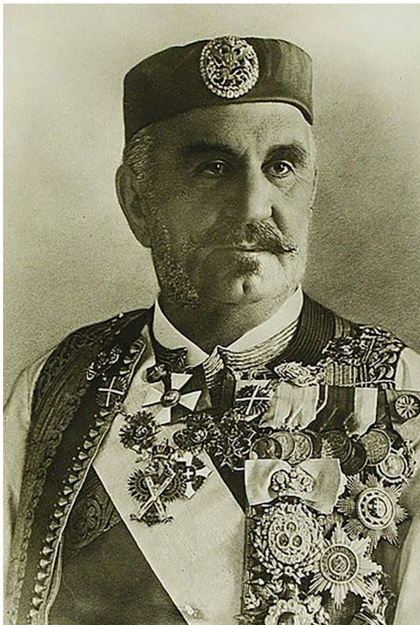
Књаз Никола Петровић - нејознај аутор.