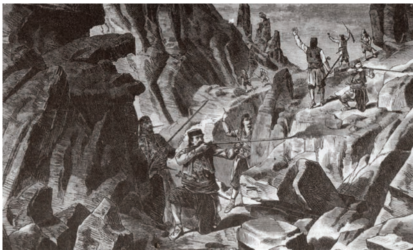
Херцеговци у засједи, (Србадија - Беч, година прва, свеска 10, 1875)

Устанак који је избио у Херцеговини у љето 1875. био је главни замајак избијања немира широм Балкана у наредних годину дана. Управо је овај покрет, предвођен од сеоске „елите” зарад избављења сопственог народа из канџи окупатора, сасвим неслућено отворио једну од највећих криза у Европи – Велику источну кризу.