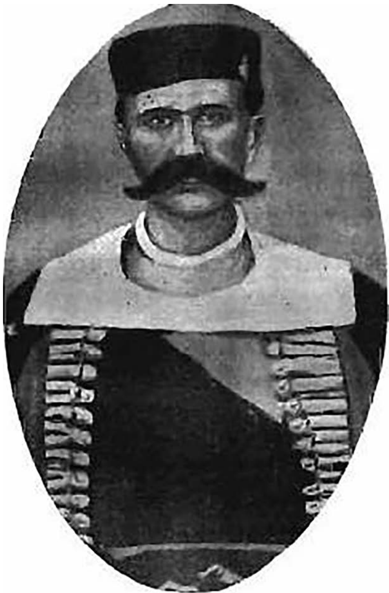
Перо Тунџуз - Саво Скоко, Антифашистичка невесињска пушка, (Невесиње–Београд: СО Невесиње - Свешћ књије), 39.