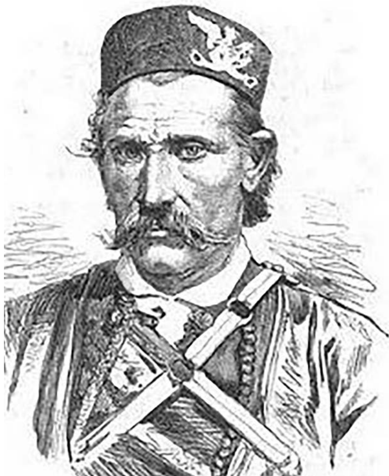
Лука Пејковић - l'Illustration, октобар 1875.