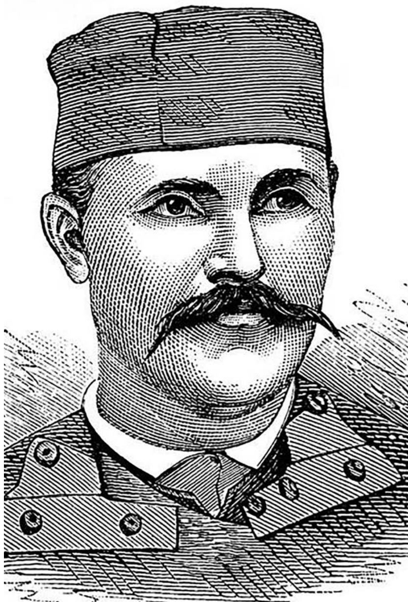
Лазар Сочица - Орао 1877.